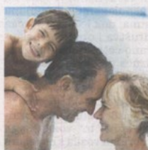
Umirovljenici mogu povesti i svoje unuke