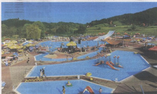
Vanjsko kupalište s četiri bazena i sporom rijekom pruža zabavu i djeci i odraslima TERME TUHELJ

zemalja te programi koji se temelje na znanju i stručnosti osoblja i na prirodnim vrijednostima Termi Tuhej – termalnoj vodi i ljekovitom blatu. Tu je i hamam za orijentalne tretmane opuštanja te wellness suite. Terme Tuhej stalno osmišljavaju nove atraktivne sadržaje za svoje goste, a osobito se brinu za potrebe obitelji. Gostima nude bogatu animaciju za odrasle i djecu, koja se temelji na vodenim zabavno-rekreacijskim aktivnostima, primjerice vježbe u termalnoj vodi, vježbe s fizioterapeutom, šetnje prirodom, nordijski hodanje, popodnevni aquaerobic, Tuhi aqua fun za djecu, kreativne radionice na bazenima i u dječjoj igraonici, sportska natjecanja, glazbene večeri u Infinity baru petkom, plesne večeri u dvorcu Mihanović subotom... Radnici mogu upoznati i okolicu Termi Tuhej, primjerice galeriju Antuna Augustinčića u Klanjcu, spomenik hrvatskoj himni u Zelenjaku, Staro selo Kumrovec, dvorac Veliki Tabor, muzej Seljačkih buna i muzej Krapinskih neandertalaca.