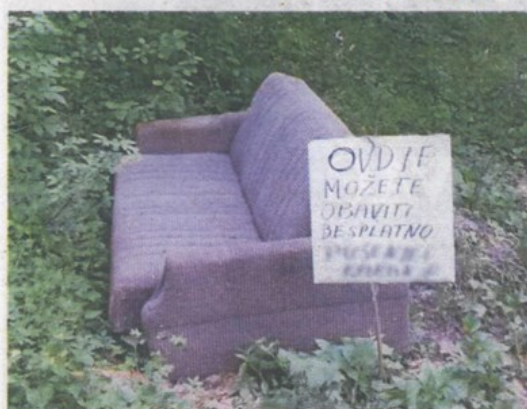
Netko je jednom rekao da ljudska glupost nema granica A. BRODAR

Sad ozbiljno, kakav 'majstor' moraš biti da stari kauč baciš na Hušnjakovom?