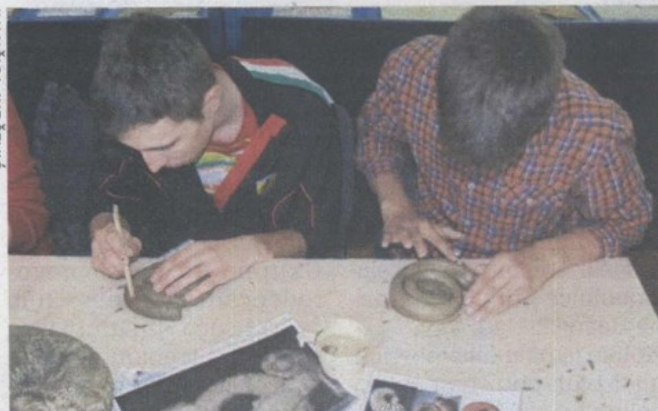
Učenici su, između ostalog, izrađivali glinene modele fosila

U sklopu programa 12. Festivala znanosti, projekta Tehničkog muzeja čija ovogodišnja tema nosi naziv „Valovi“, Muzej krapinskih neandertalaca je organizirao radionice u kojima su sudjelovali učenici OŠ Đurmanec, OŠ Ljudevita Gaja iz Krapine te Srednje škole Krapina.