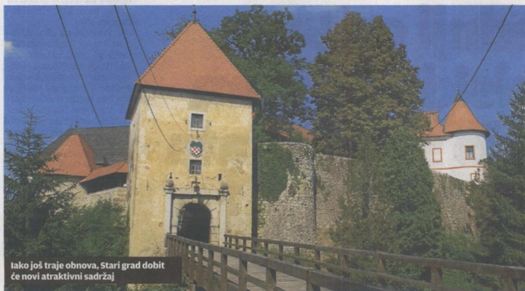
Iako još traje obnova, Stari grad dobit će novi atraktivni sadržaj

PUT U POVIJEST Krizu ozaljskog Zavičajnog muzeja riješit će autor bivšeg postava