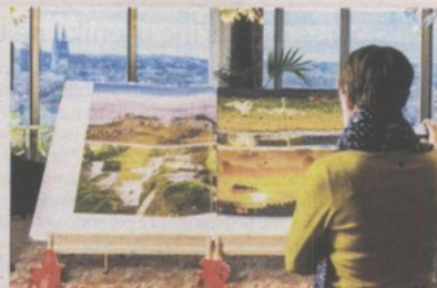
"Neodoljiva Hrvatska" možda uskoro u "Guinnessu"

Guinnessova knjiga rekorda (eng. Guinness World Records) je godišnji pregled svjetskih rekorda, kako čovjekovih postignuća tako i prirodnih fenomena. Prvi put ju je 1955. objavila pivarska tvrtka "Guinness". Od svog prvog izdanja prodana je u više od sto milijuna primjeraka, prevedena je na 25 jezika, a svake se godine proda više od četiri milijuna primjeraka u stotinjak zemalja u kojima izlazi. Počelo je prije šest desetljeća kad je sir Hugh Beaver, nakon lova, upao u raspravu koja je europska ptica najbrža - zlatni žalar ili jarebica. Odgovor nisu nudile ni dostupne knjige pa je angažirao jednu londonsku agenciju da to otkrije, počevši rad na knjizi koja će ponuditi odgovore na sve slične dvojbe.