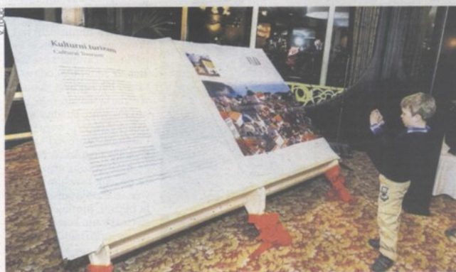
Katalog možda s trona u Guinnessovoj knjizi izgura njemački modni katalog