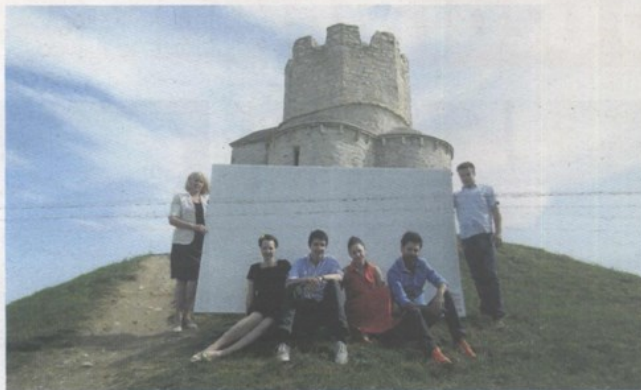
Prošlog ljeta s katalogom ispred crkve Sv. Nikole u Ninu