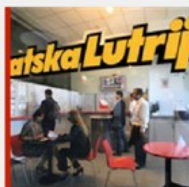
TAKO NAM JE TO Hrvatska dobila još jednu milijunašicu!