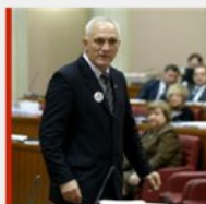
STANKA NA STANKU NA 'Vrijeme je za promjenu ovog komunističko-

Tportal.hr koristi kolačiće („cookie“) kako bi vam pružio bolje korisničko iskustvo. Nastavkom pregleda tportal.hr stranice slažete se sa korištenjem kolačića. Više informacija zatvori obavijest