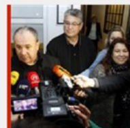
...A BALDASAR I DALJE Kerum: Hoće li USKOK istraživati i snijeg u Splitu?