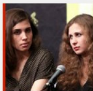
U SOČIJU Uhićene dvije članice Pussy Riota