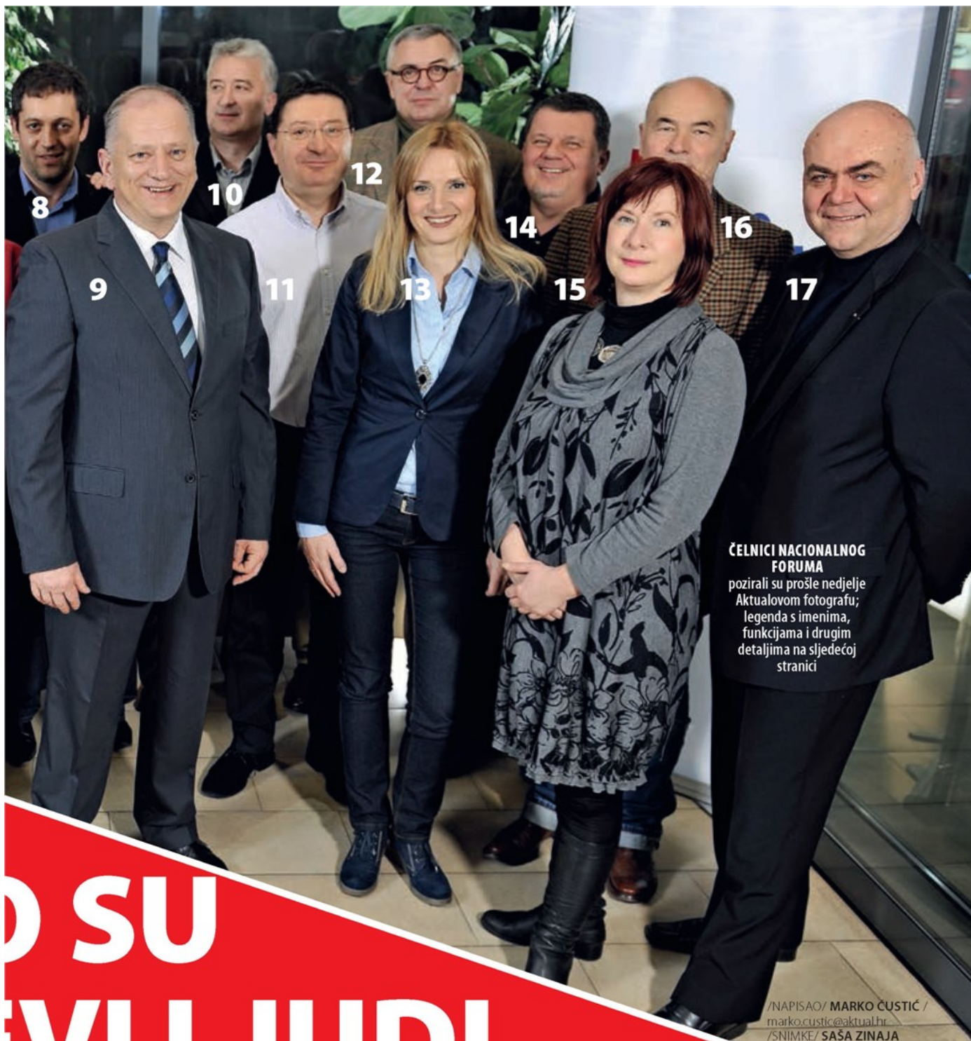
ČELNICI NACIONALNOG FORUMA pozirali su prošle nedjelje Aktualovom fotografu; legenda s imenima, funkcijama i drugim detaljima na sljedećoj stranici

/NAPISAO/ MARKO ČUŠTIĆ / marko.custic@aktual.hr