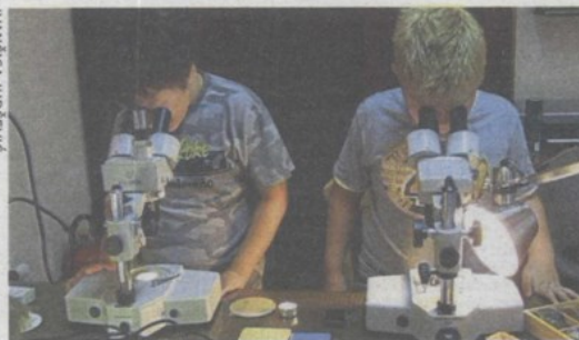
Djeca istražuju prapovijest u geološkom laboratoriju

Djeca imaju priliku razgledati stalni postav muzeja, a radionice će se odvijati i na samom nalazištu Hušnjakovo. U Muzeju je postavljena i izložba "Vulkan (i) Hrvatskog zagorja.