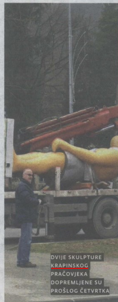
DVIJE SKULPTURE KRAPINSKOG PRAČOVJeka DOPREMLJENE SU PROŠLOG ČETVRTKA