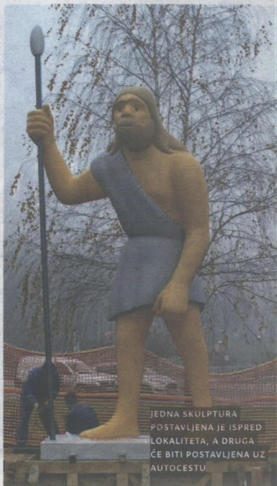
JEDNA SKULPTURA POSTAVLJENA JE ISPRED LOKALITETA, A DRUGA ĆE BITI POSTAVLJENA UZ AUTOCESTU

KRAPINA – Prošlog su četvrtka u Krapinu dopremljene dvije skulpture krapinskog pračovjeka autora Denisa Kraškovića koje je naručila Turistička zajednica Grada Krapine. Jedna je postavljena na platou ispred lokaliteta, a druga se predviđa postaviti uz autocestu. Svojim izgledom, ali i zbog medijske buke koja je nadavno nastala zbog šest metarskih skulptura, veliki su neandertalci već pobudili veliko zanimanje građana. Dok Muzej krapinskih neandertalaca prigovara ovakvom rješenju prikaza krapinskog pračovjeka koje, smatraju muzejski stručnjaci, uopće nije vjerna slika neandertalca , iz Turističke zajednice kažu da se radi o skulpturama koje je izradio renomirani umjetnik i koje će privlačiti turiste. I građani naše županije imaju različite komentare na skulpture, pa su tako putem Facebooka neki izrazili oduševljenje, dok je većina njih nezadovoljna načinom na koji je prikazan krapinski pračovjek . (J. Sačar)