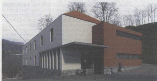
Kulturni centar Klanjec

Ovaj projekt multimedij-skog i interaktivnog prostora u Klanjcu bio je jedan od prioriteta jer je rješavao goruće pitanje klanječkog depoa koji su Muzeji godinama nastojali riješiti. No, dio zgrade koju smo koristili bio je u rukama privatnog vlasništva. Stoga smo započeli intenzivnu suradnju s Gradom Klanjcem koji je također vidio interes u uređenju ovog objekta te je riješio vlasničke odnose pa smo, nakon projektne dokumentacije pripremljene zahvaljujući sredstvima Ministarstva kulture, prijavili projekt na natječaj – istaknula je muzejska savjetnica Goranka Horjan, koja je kao tadašnja ravnateljica Muzeja radila na izradi projekta zajed-