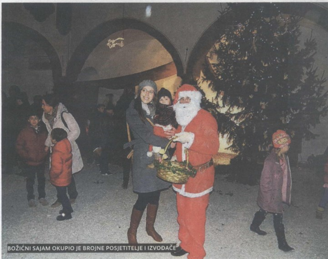
BOŽIČNI SAJAM OKUPIO JE BROJNE POSJETITELJE I IZVOĐAČE