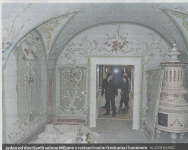
Jedan od dovršenih salona Miljane s restauriranim freskama i kaminom