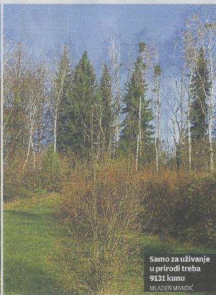
Samo za uživanje u prirodi treba 9131 kunu MLADEN MANDIĆ