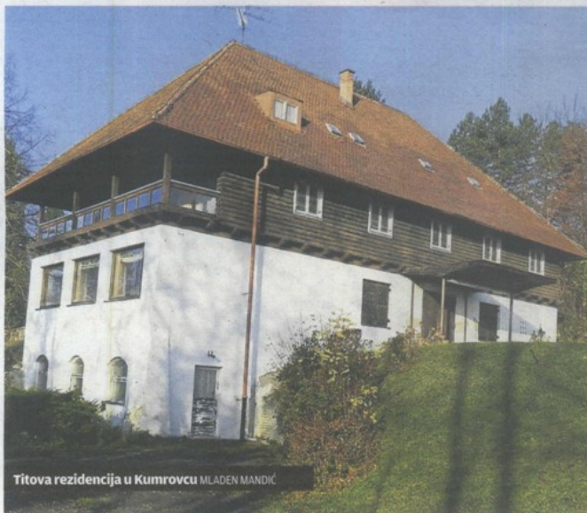
Titova rezidencija u Kumrovcu MLADEN MANDIĆ

Već 20 godina ništa se ne uspijeva privatizirati