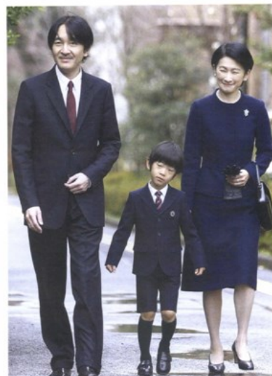
Japanski princ Akishino , mlađi brat japanskog prestolonasljednika Naruhita, i njegova supruga princeza Kiko , za prošlogodišnje europske turneje od hrvatskoga predsjednika Ive Josipovića dobili umjetničke fotografije Hrvatske, maslinovo ulje i lepoglavsku čipku, a obitelj Vrhovski iz Prigorja, koja se bavi autohtonim uzgojem zaštićene pasmine zagorskog purana darovala im je skulpturu te ptice izrađenu od fosilnog drveta, rad lepoglavskoga kipara Dragutina Jamnića

Predsjednik Ivo Josipović princu je darovao umjetničke fotografije Hrvatske, a princezi maslinovo ulje i poznatu lepoglavsku čipku. Posjetili su i OPG Vrhovski u Prigorju, koji se bavi autohtonim uzgojem zaštićene pasmine zagorskog purana. Obitelj Vrhovski darovala im je skulpturu purana izrađenu od fosilnog drveta, lepoglavskoga kipara Dragutina Jamnića. Također, posjetili su Muzeji krapinskih neandertalaca , dobili monografiju o Hrvatskom zagorju... Prije nekoliko godina šestorica vrbničkih i jedan vinodolski vinar okuse i mirise svoga kraja u tri mjeseca pretočili su u zlahtinu koju je tijekom svog posjeta Hrvatskoj pio papa Benedikt XVI. Misao vodilja, kako su svojedobno rekla 'sedmorica veličanstvenih', bila je spojiti 'spiritus' i 'spiritus'.