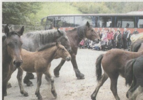
Prilikom fotografiranja gostiju u kadar su utrčali hladnokrvnjaci

konjima, pa i s četveropregom, između vodoskoka i pozornice, odakle je stizala velika buka s razgla. Test poslušnosti konja i umijeća kočijaša je uspješno položen.