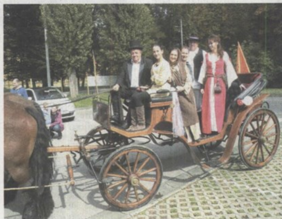
U Gajnicama je kočija puna putnika izvozila brojne krugove

Gotovo se može reći kako se konje nije ni stiglo raspregnuti jer ih je već idućeg dana čekala vožnja na manifestaciji "Branje grozdja Pregrada 2014." Veliki broj gledatelja okupljenih u središtu Pregrade imao je priliku vidjeti šest živopisnih zaprega udruge ŽUUK-a. Mora se naglasiti da su neki gledali konje, a neki vješte kočijaše za koje je bio veliki izazov proći s