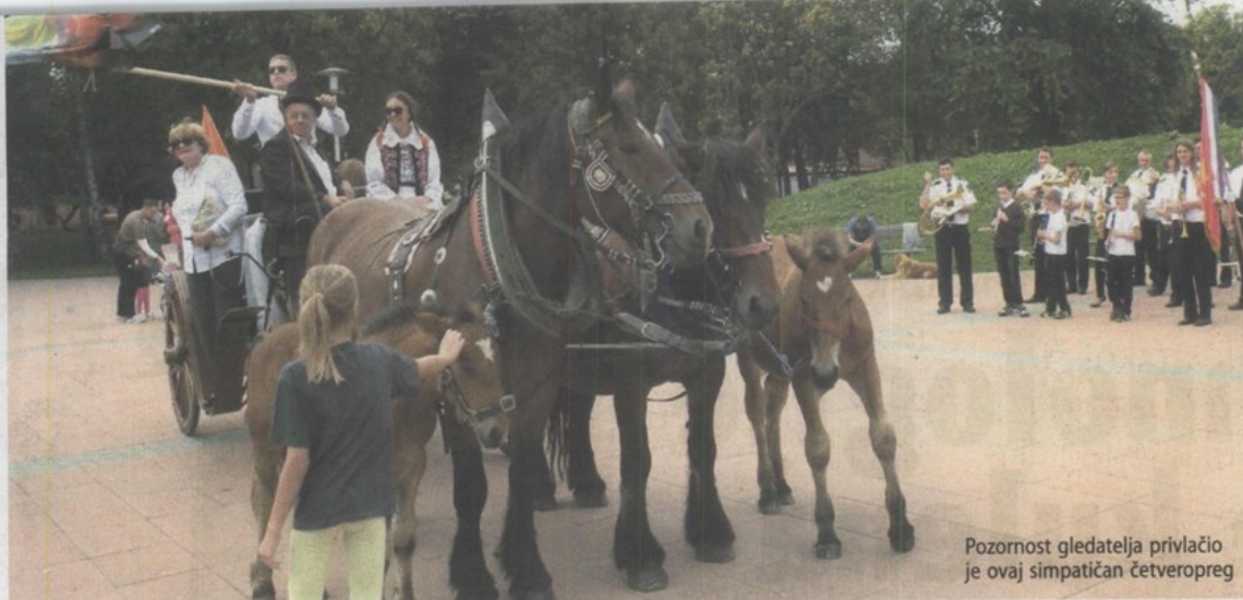
Pozornost gledatelja privlačio je ovaj simpatičan četveropreg

Ključne riječi: NEANDERTALCI, MUZEJ KRAPINSKIH NEANDERTALACA, MUZEJI