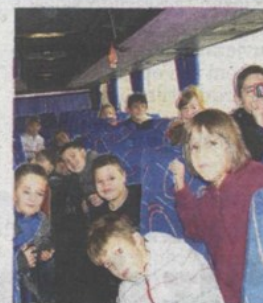
Klinci iz 4. b razreda na putovanjima OŠ VOJNIĆ

seljačkih buna. Istoga dana, klinci su sa učiteljicom, kako bi razvijali multietičnost, posjetili i tri svetišta; pravoslavnu crkvu Svetog Nikole u Karlovcu, Svetište Majke Božje Trsatske i Islamski centar u Rijeci. (sb/VLM)