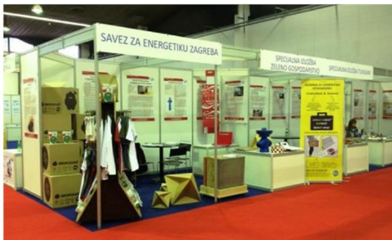
Fotografija: Zajednički nastup tvrtki na štandu Saveza za energetiku Zagreba (INOVA 2013.)