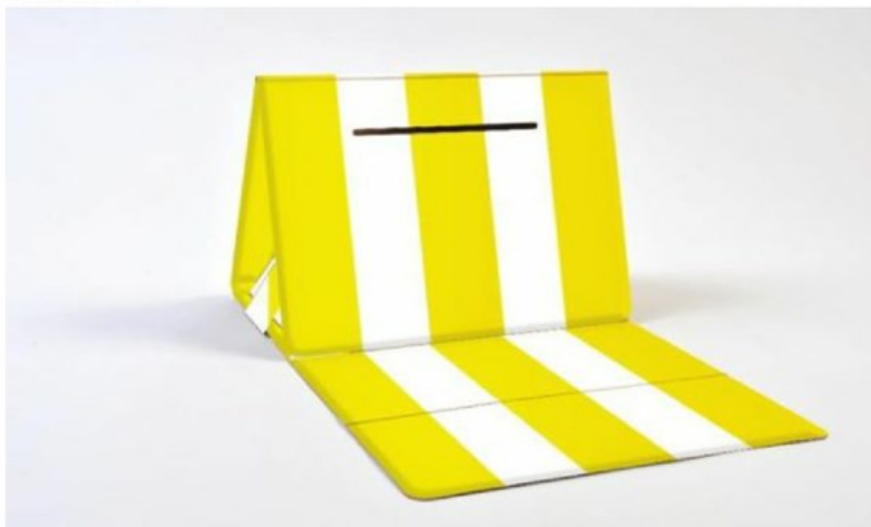
Fotografija: CROECOSEAT - Ekološko prijenosno kartonsko sjedalo s inovativnim držačem za napitke

Na Zagrebačkom velesajmu od 12. do 17. studenog 2013. godine održava se 38. Hrvatski salon inovacija s međunarodnim sudjelovanjem - INOVA te 9. Izložba inovacija, prototipova i studentskih poslovnih planova - BUDI UZOR. Sajmovi se održavaju u organizaciji Hrvatskog saveza inovatora, Saveza inovatora Zagreba i tvrtke TERA-TehnoPolis, suorganizaciji Saveza riječkih inovatora, Saveza inovatora Primorsko-goranske županije, Hrvatske udruge inovatora-poduzetnika te Saveza za energetiku Zagreba, a pod pokroviteljstvom gradonačelnika Grada Zagreba, gospodina Milana Bandića, supokroviteljstvom Hrvatske gospodarske komore i svjetskim pokroviteljstvom World Invention Intellectual Property Association-a.