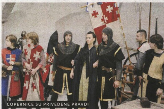
COPERNICE SU PRIVEDENE PRAVDI