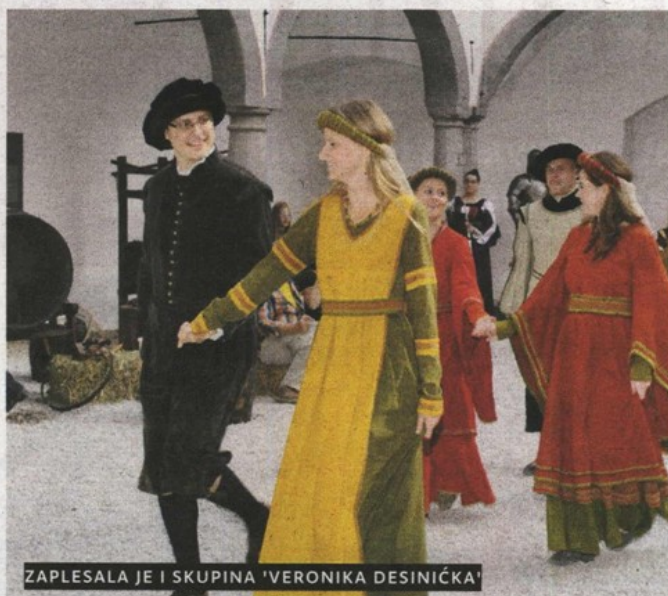
ZAPLESALA JE I SKUPINA 'VERONIKA DESINIĆKA'